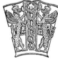
Resim-1: 2 yılan ve sarılı olduğu yaşam ağacı

T ıbbın ve eczacılığın temsili için yılan sembolü kullanılır. Yılan kendisine çok zıt anlamlar yüklenen canlıdır. Bir yandan insanlar için ürkütücü ve soğuk bir hayvandır; ama aynı zamanda insanlık tarihi boyu bilgeliğin, tıbbın ve sağlığın sembolü olagelmıştır. Yılan gibi zehirli ve tehlikeli olabilen bir hayvanın sağlık ve hekimlik sembolü olarak kullanılması oldukça tezat gelse de aslında ilginç bir hikayesi vardır.