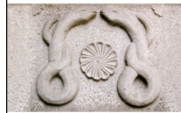
Resim-3: Gevher Nesibe şifhanesi kapı kabartması

Türk-islam devletlerinden Tolunoğulları devleti Mâristan denilen hastaneler kurmuştur. "Mâr" kelime anlamı olarak yılan demektir, yani şifahaneler yılanlar diyarı olarak biliniyordu. Anadolu Selçuklu devletinde de şifahanelerin kapısında çifte yılan kabartmaları bulunur (Resim-3). Selçuklulara göre hastalık kötülük ve ceza demektir, kötülüklerinde yılanlar gibi yeraltından geldiğine inanılmıştır. Ayrıca Selçuklu hekimlerin mezar taşlarında yılan kabartması görmek mümkündür. Yılanlardan öldürücü olduğu için hem ürkümüşler hem de gücünden dolayı korkuyla karışık saygı duymuşlardır.