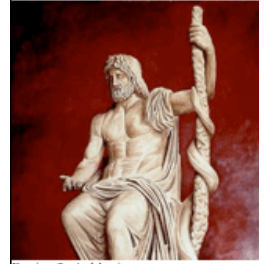
Resim-2: Asklepios ve asası

Yunan kültüründe tıbbın sembolü yine yılanlardır. Buradaki sembol sağlık tanrısı Asklepios'dan (Resim-2) gelir. Asklepios bir yılanın sarılı olduğu asasıyla sifa dağıtan bir hekim-tandır. Asklepios'a göre hekim yılan gibi dilsiz olmalı, kimsenin sırrını başkasına söylememeli; sakin ve sabırlı olmalı. Asa ise hekimliğin kısa sürede öğrenilemeyecek, ihtiyarlanana kadar öğrenmeye ve tecrübe edinmeye gereksinim duyduğunu belirtmek içindir.