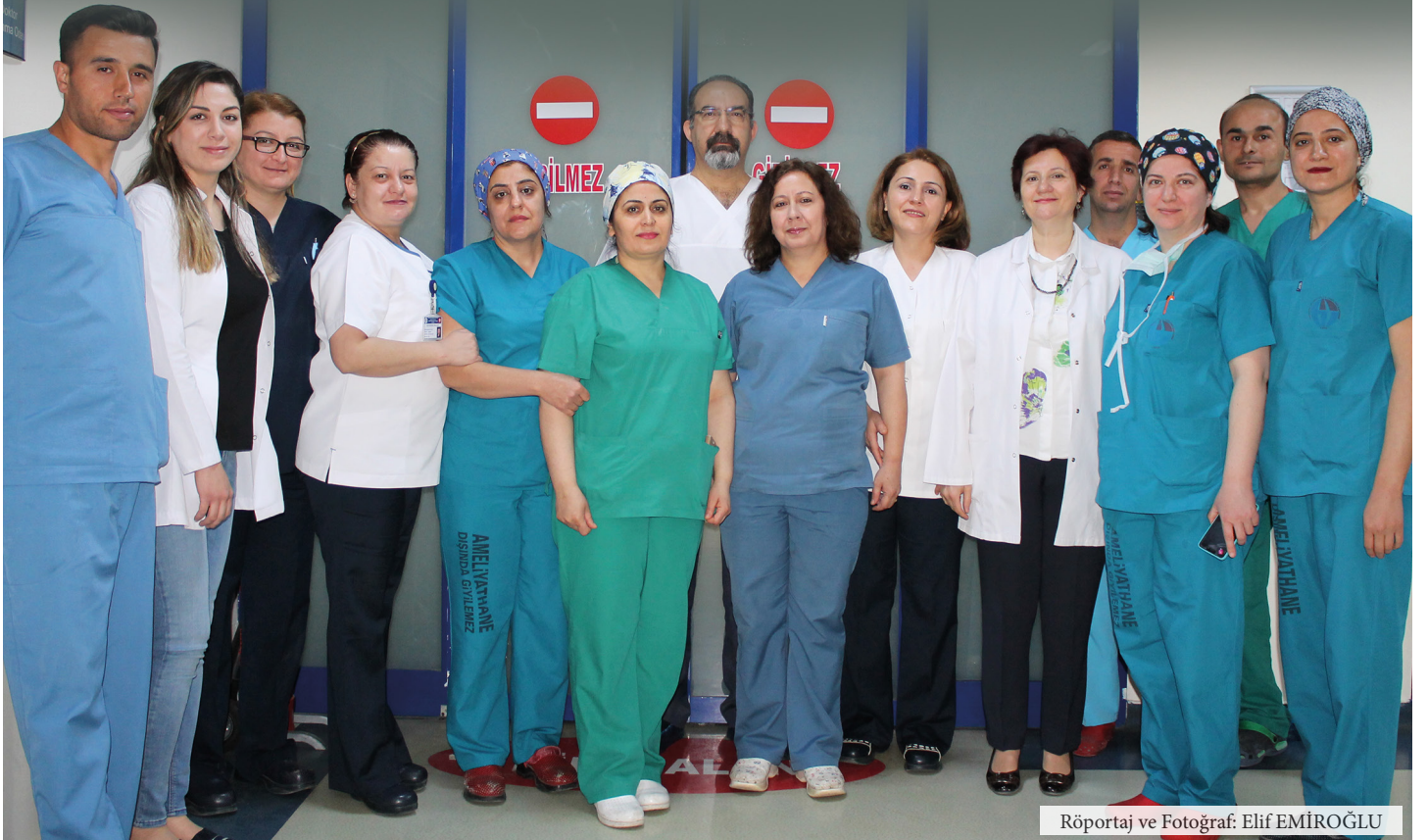
Röportaj ve Fotoğraf: Elif EMİROĞLU

H astaya aynı gün içinde yatış yaparak, operasyon ve taburcu işlemlerini gerçekleştiren ve hasta konforu açısından son derece önemli işlere imza atan Gaziantep Üniversitesi Şahinbey Araştırma ve Uygulama Hastanesi bünyesindeki GÜN Hastanesi'ni bültenimizin bu sayısında sizler için işledik.