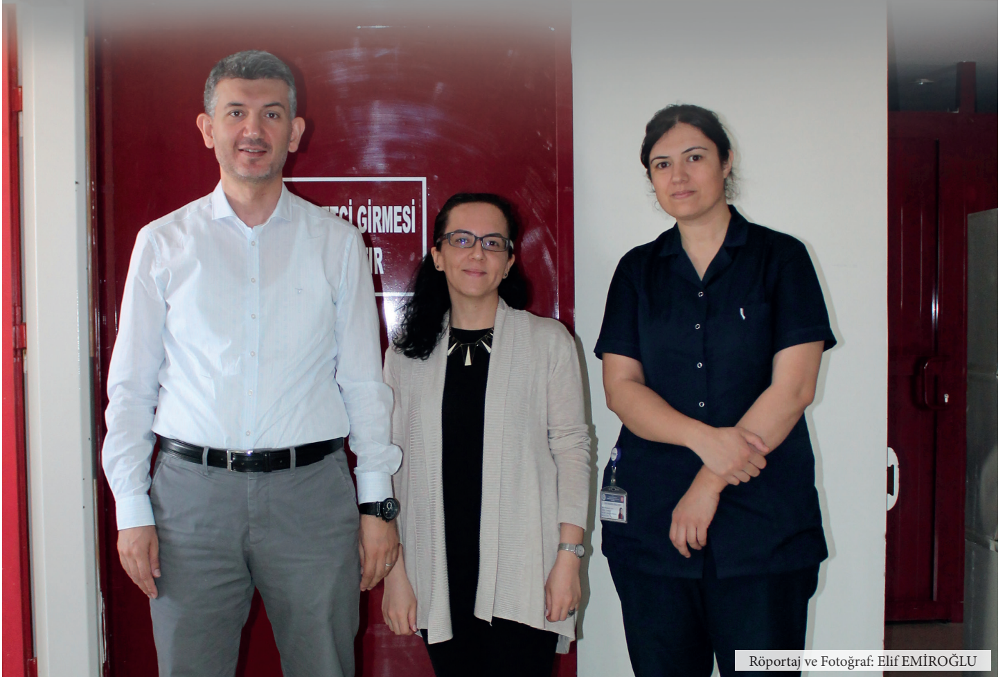
Röportaj ve Fotoğraf: Elif EMİROĞLU

Çocukluk çağında yaşamı tehdit eden en önemli hastalıklar arasında başta lösemi olmak üzere kemik iliği nakli gerektirebilen kan hastalıkları yer alıyor. Bu hastalıkların başarıyla tedavi edilmesi için ise erken tanı ve doğru tedavi uygulamaları büyük önem taşıyor.